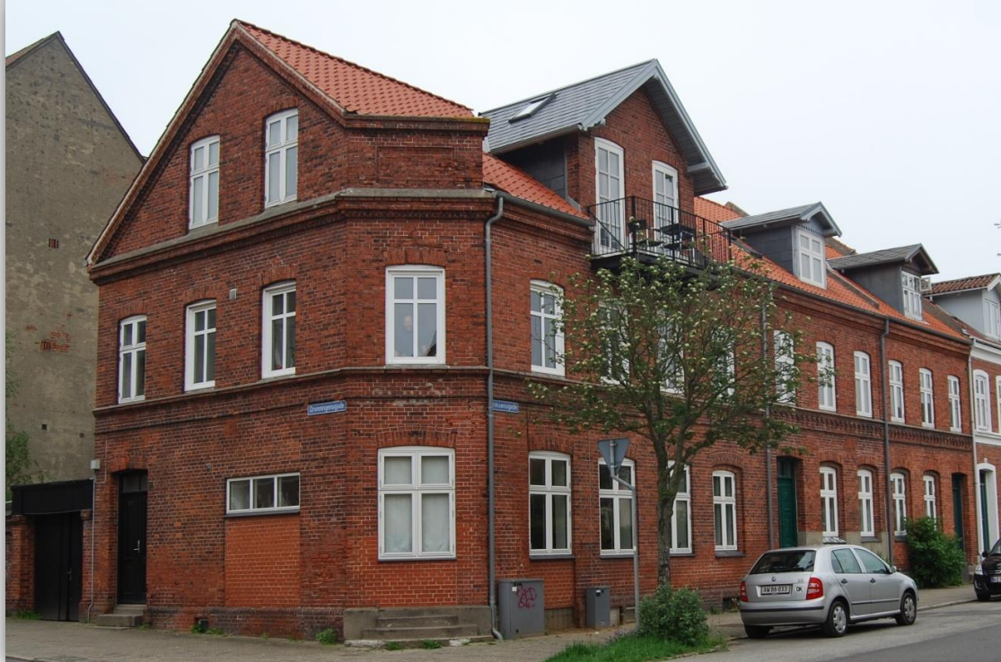
Skoletjenesten Museerne i Fredericia