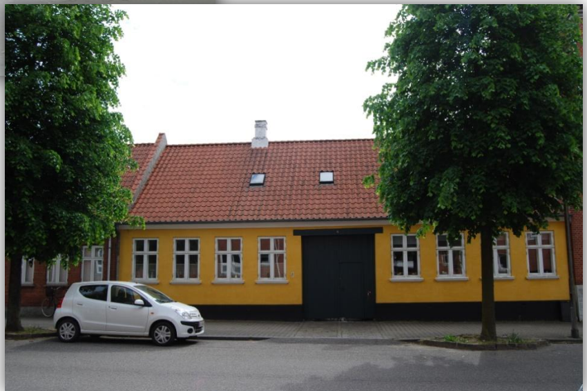
Skoletjenesten Museerne i Fredericia