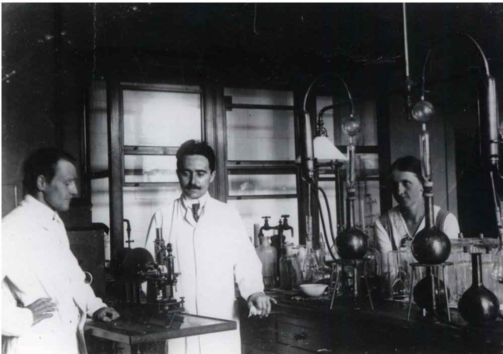
5 b. Laboratorium, Carlsberg, 1905