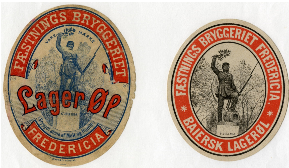
5 (Etiketter, Fæstningsbryggeriet, slutningen af 1800-tallet)