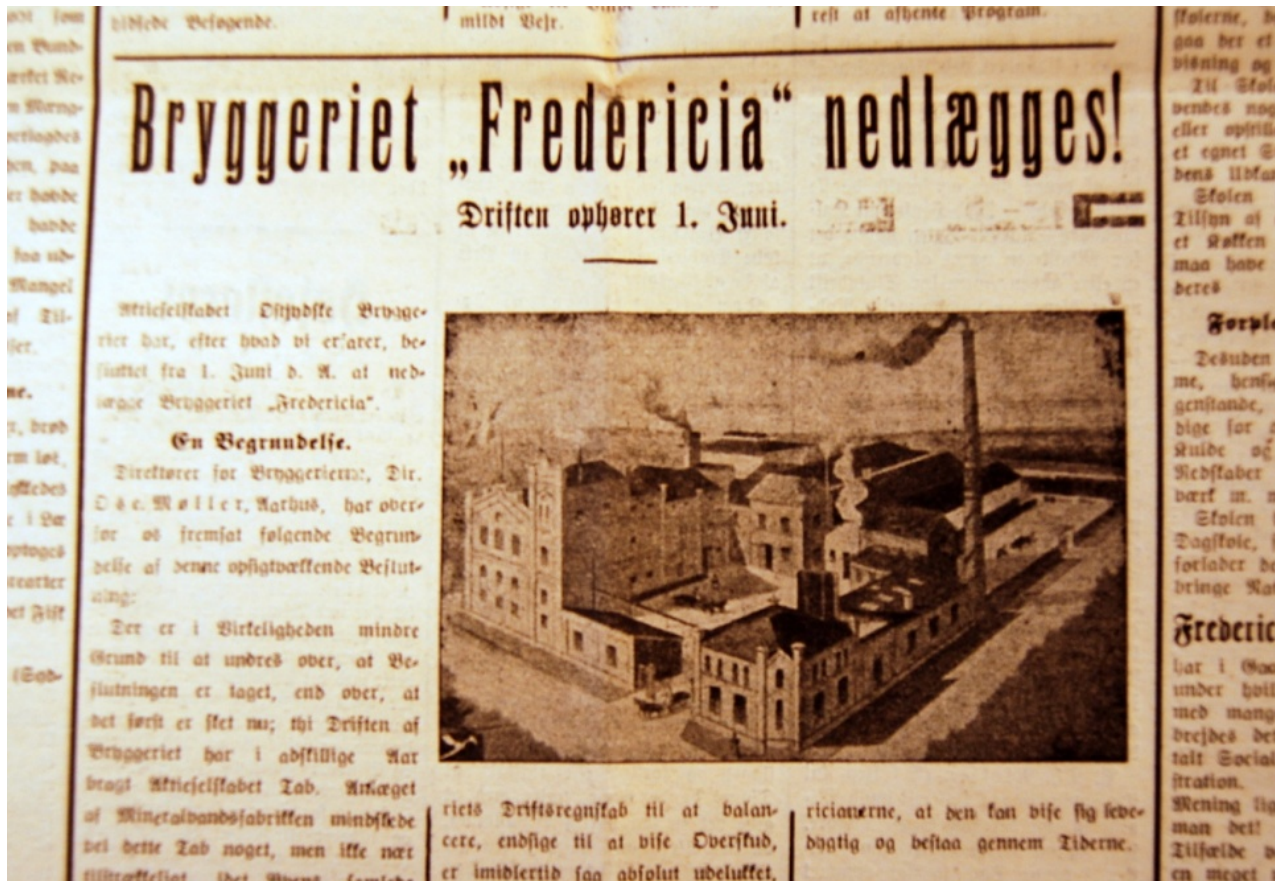
Omtale af lukning, Fredericia Dagblad, 5. maj, 1914