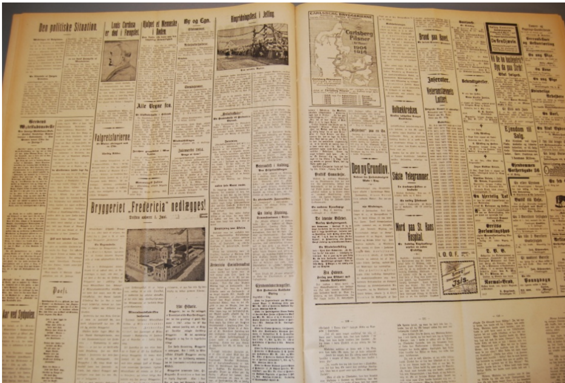
Sideopslag, Fredericia Dagblad, 5. maj, 1914