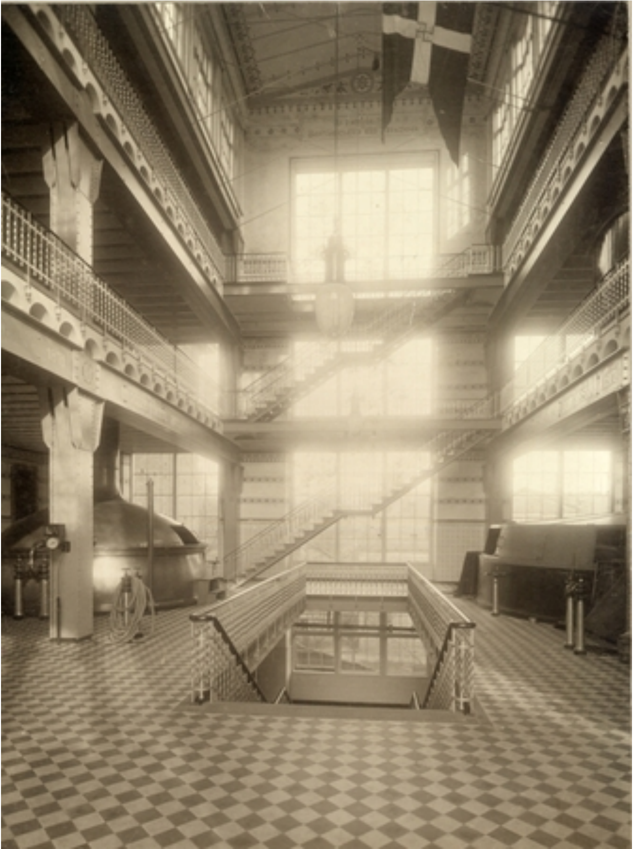
c. Indenfor Bryghuset Carlsberg, 1910