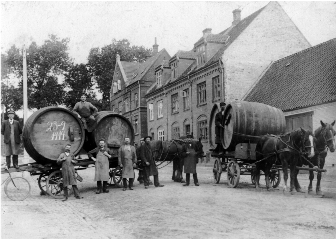
Billede fra Fæstningsbryggeriets sidste dag, 23-9-1914