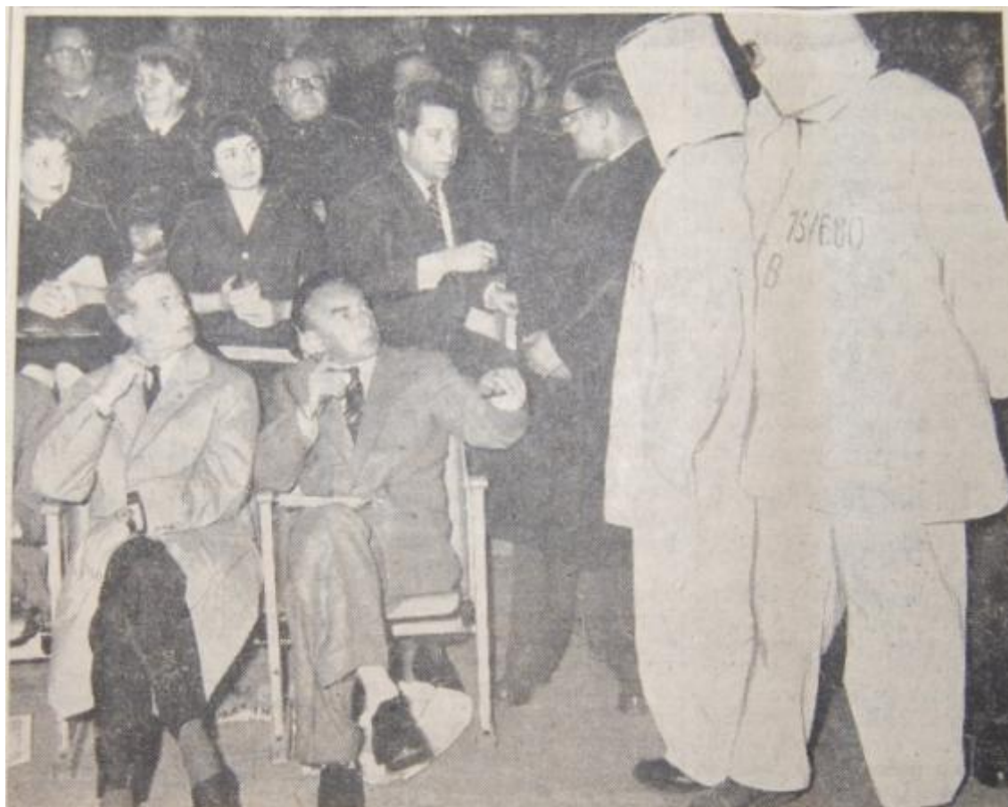
PROTEST MOD ATOMVAABEN ★ Planen om at forsyne den nye tyske Hær med Atomvaaben har som bekendt fremkaldt Modstand i vide Kredse i Tyskland, og i mange Byer holdes store Protestmøder med det Formaal at Jaa Planen omstødt. Dette Billede stammer fra et Møde i en Cirkusbygning i München. Til højre ses et Par Mænd, der har iklædt sig Dragter til Beskyttelse mod radioaktiv Bestraaling. Paa forreste Række blandt de Protesterende ses Filmskuespilleren Dieter Borsche (tv) og Forfatteren Erich Kästner.