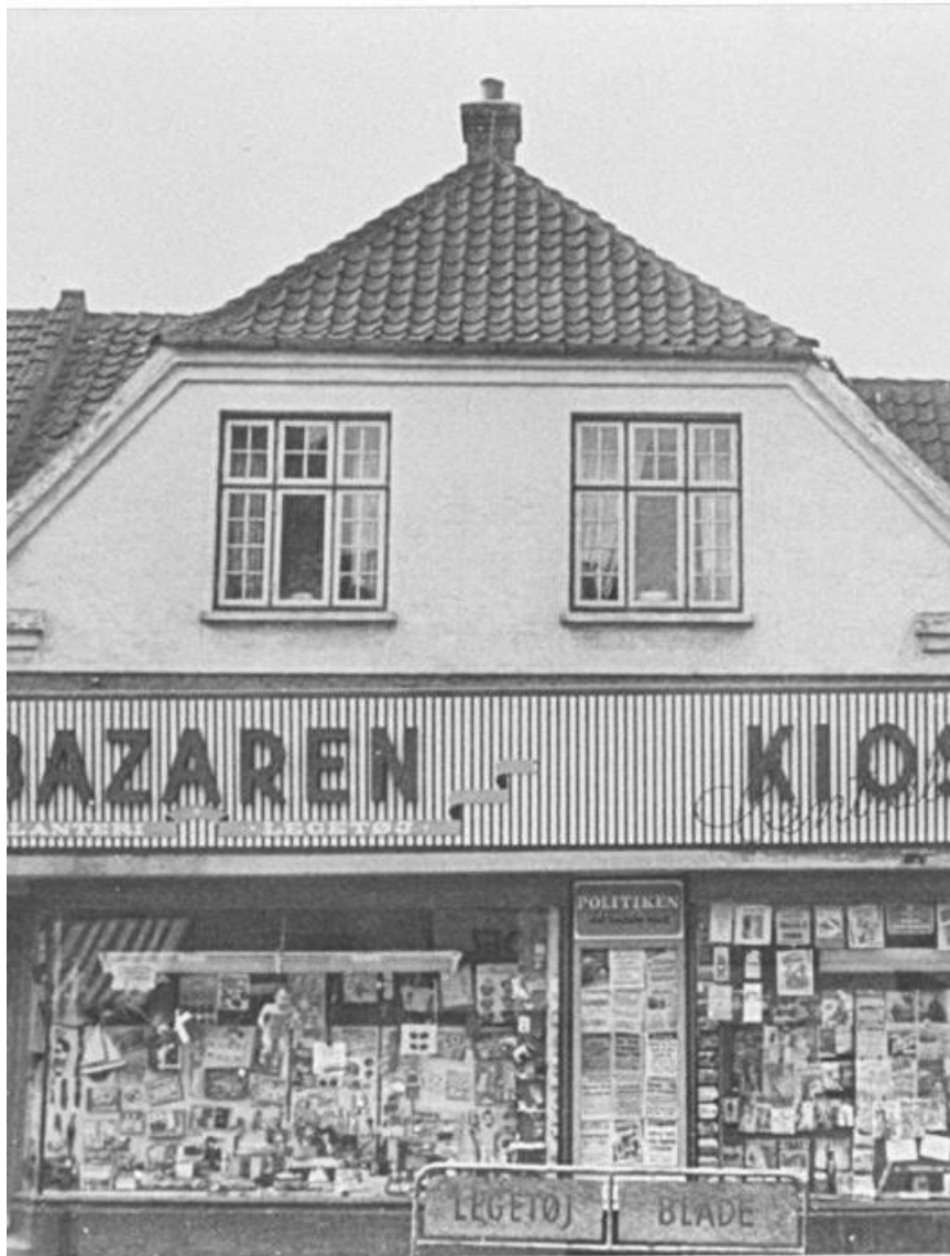
Bazaren og Kiosken