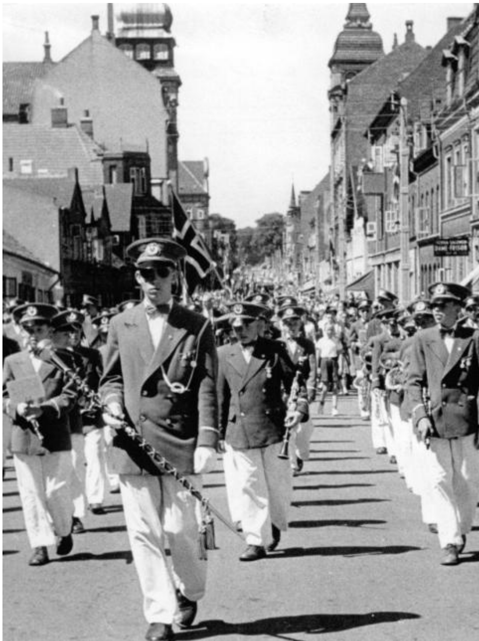
6. Juli optog med orkester, Jyllandsgade ved Kongenstræde, 1952