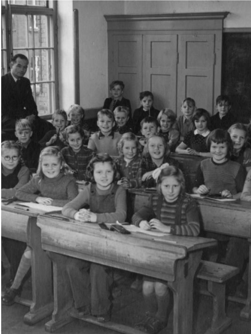
3. klasse på Købmagergadeskole, 1950-51