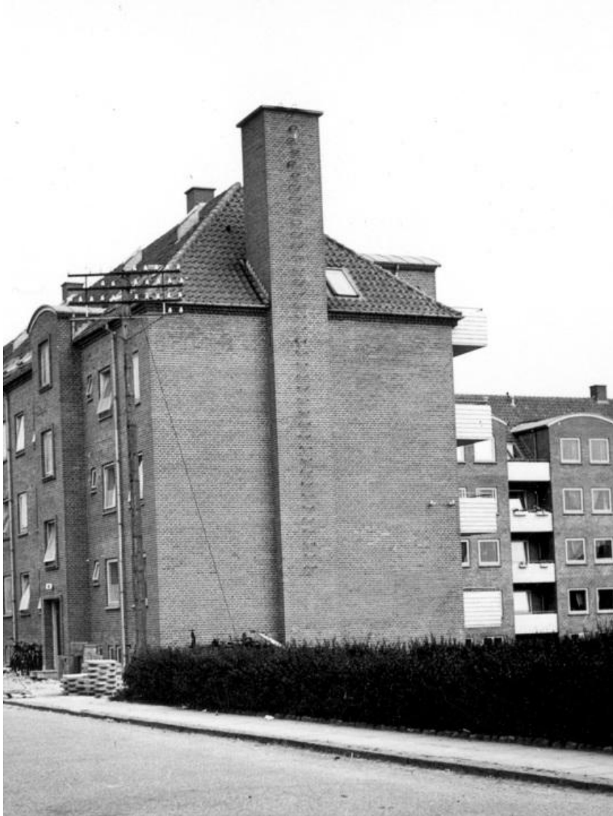
Ørnegården ved Høgevej, 1953