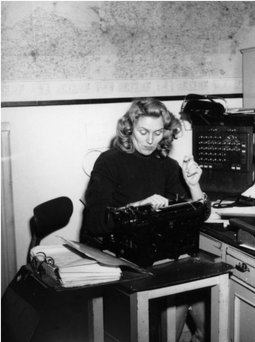
Avisen Jyske Tidende, 1958