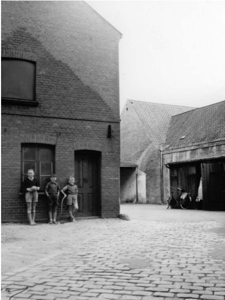
Arbejdernes aktiebageri, Kongensgade 29a og b, 31a og b