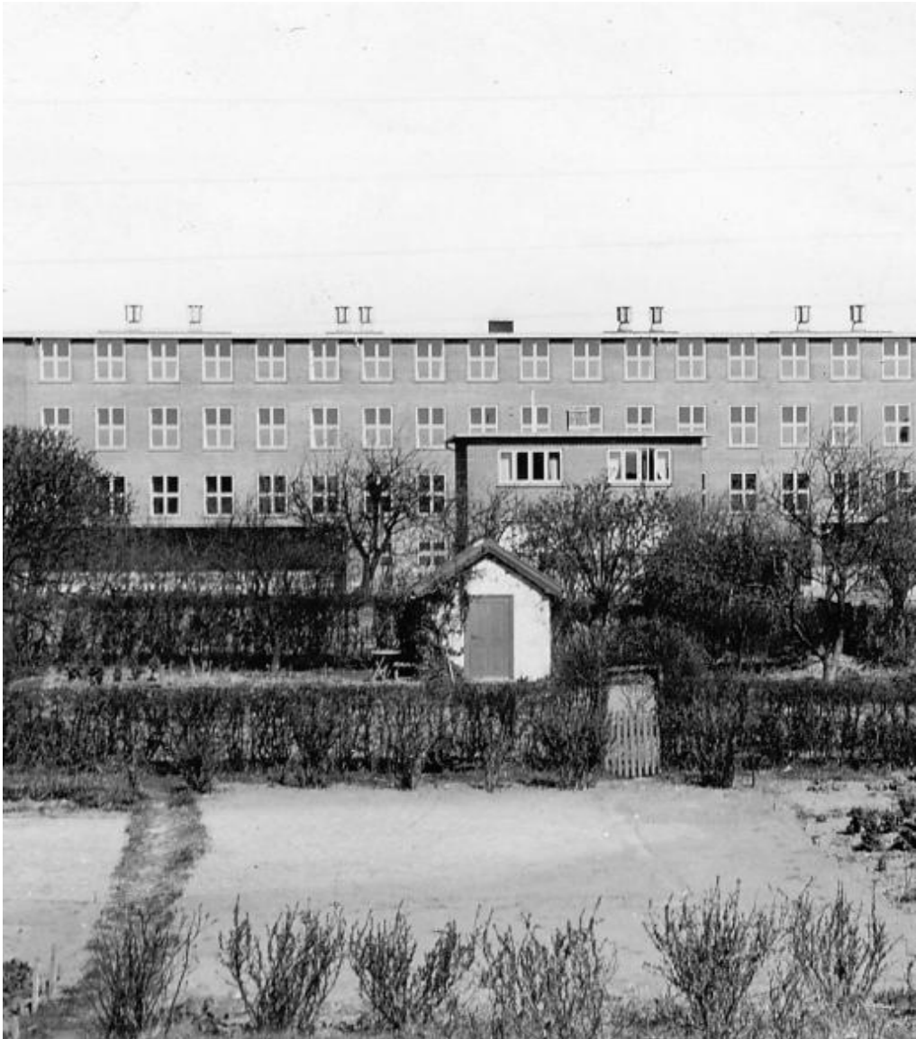
Egumvejens Skole set fra Glentevej, 1950