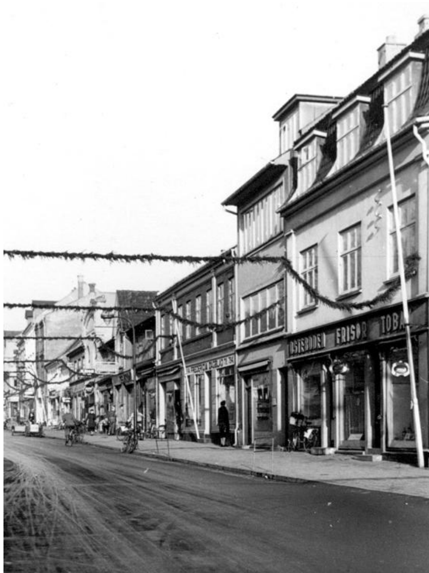
Gothersgade (med julepynt) set fra Ryes Plads, 1952