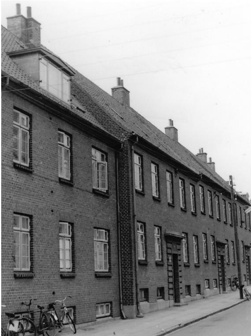
Ørnevej set fra Falkevej mod skolen, 1958