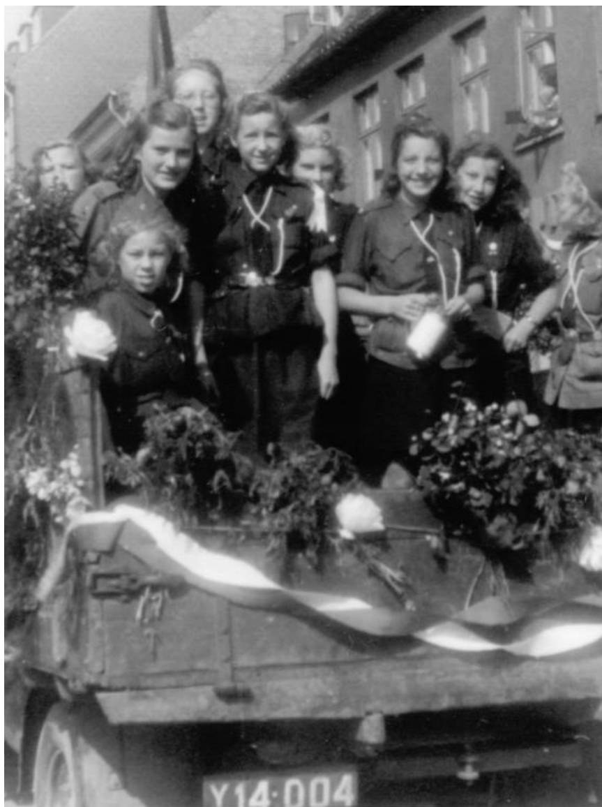
Blå pigespejdere i optog, Børnehjælpsdagen, 1956