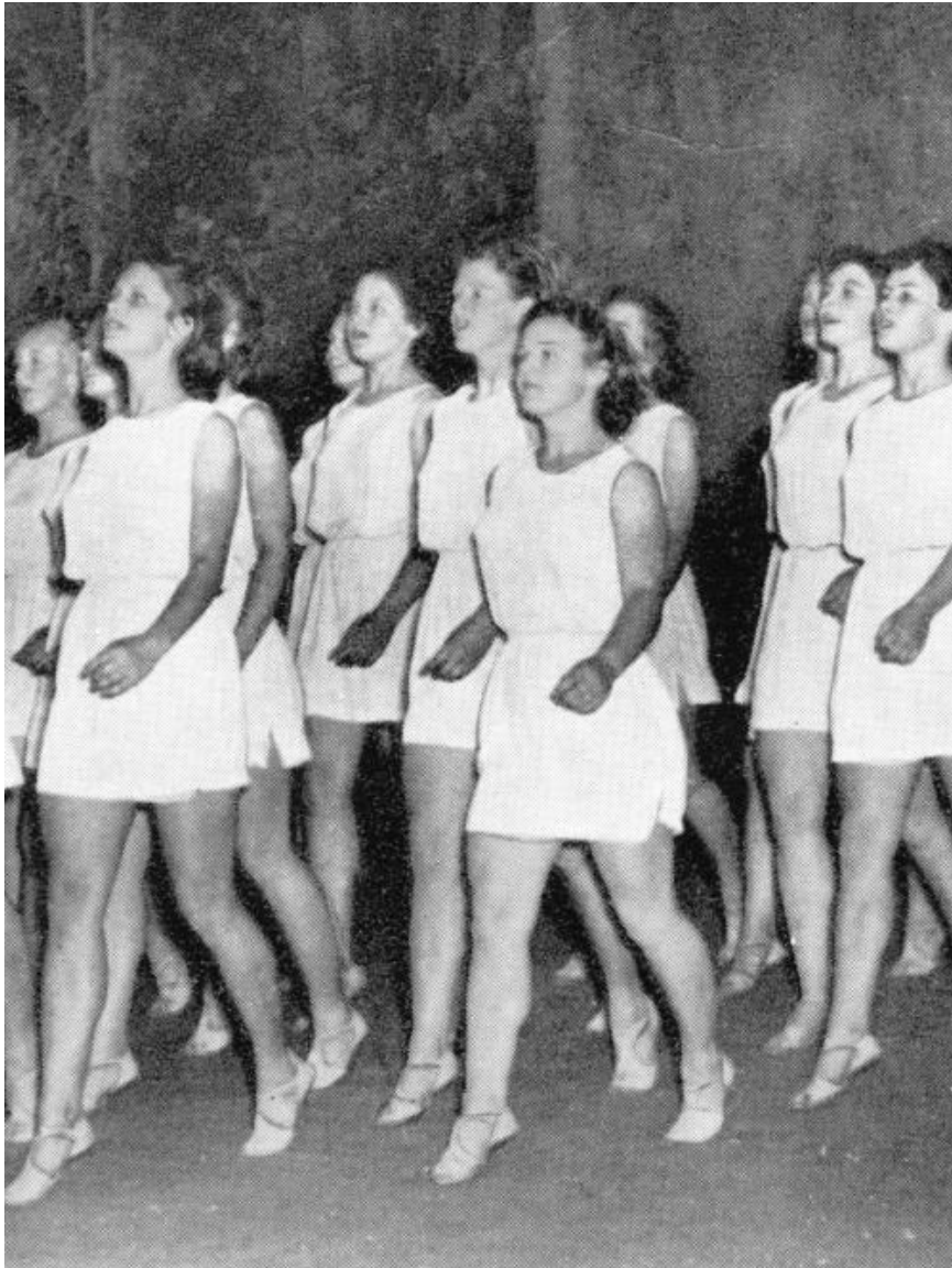
Gymnastikhøjskolen Snoghøj, 1951