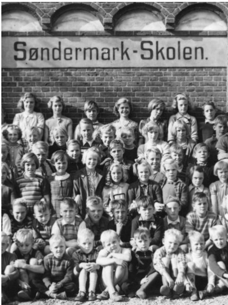
Søndermark Skolen, 1952