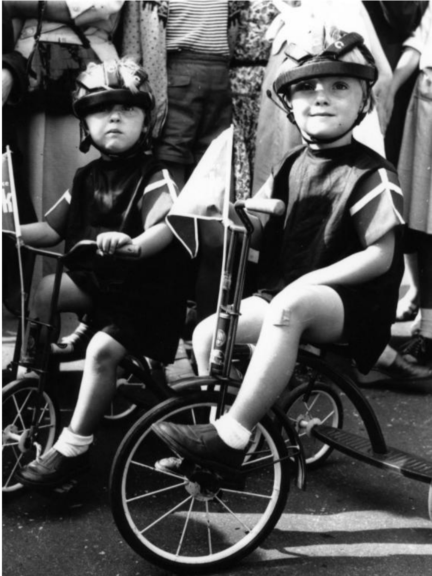
Børn på cykler, 1958