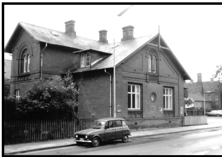
Oldenborggade 2 (ca. 1980).

Frit Hus lukkede igen i oktober 1973 efter en periode med uorganiseret ledelse, manglende kræfter til drift og arrangementer, og generelt dalende brug af huset generelt. I stedet blev huset omdannet til Ungdommens Hus for Ungdomsklubber, Ungdomsskolen og andre foreninger.